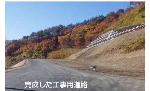
完成した工事用道路

宮古市川井地区において昨年の4月から工事着手し、今年10月末をもって工事を完了する事ができました。主な工事はトンネルを造るための工事用道路と、それに伴う本線の切土と法面保護、(仮)下片巣接続橋の橋台、小米沢への林道切回し道路を造る工事でした。工事中は、地域住民の皆様には多大なご迷惑をお掛けしました。皆様のご支援とご理解、そして人情に感謝しながら無事工事を終えることが出来たことに心より感謝申し上げます。