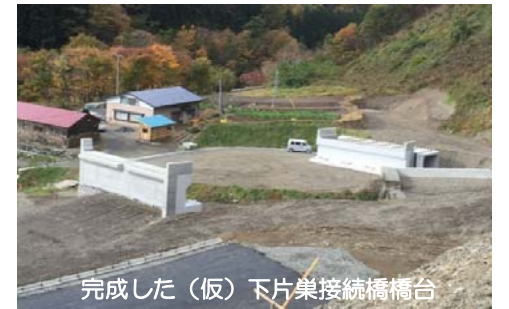
完成した(仮)下片巣接続橋橋台