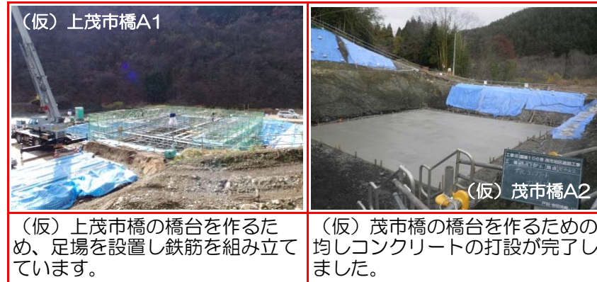
③施工：戸田・岩田地崎JV